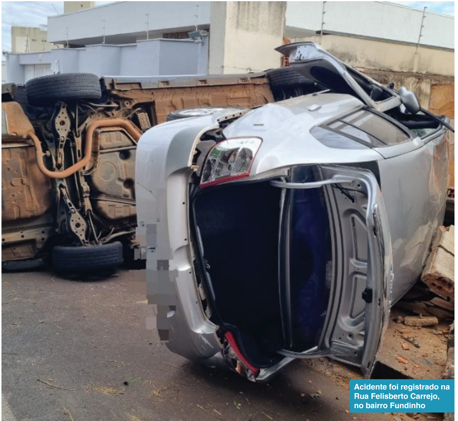
Acidente foi registrado na Rua Felisberto Carrejo, no bairro Fundinho